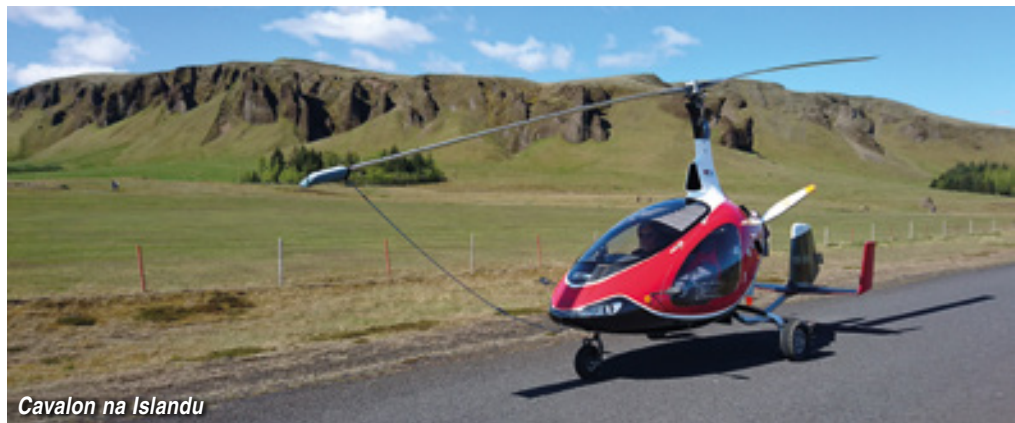
Cavalon na Islandu

Kirkjubaejarklavstur. Přestavíme vírníky na cestu po zemi a vyrážíme do hospody na večeri. Obsluhuje nás milá holka z Liberce. Ta nám dává tip na kempink kousek za vesnicí pod vodopádem. Tam mezitím přijíždí Manka a my rádi využíváme nocleh ve vytopené kabině.