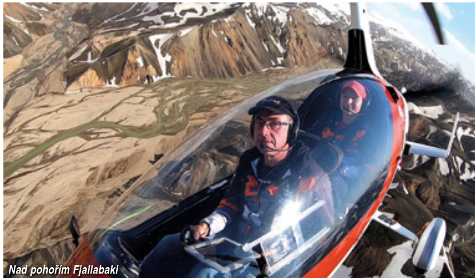
Nad pohořím Fjallabaki