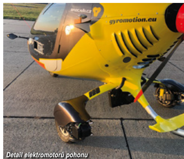
Detail elektromotorů pohonu

(BIRK), ale hlavně cesta s vírníky z letiště po zemi, středem města. Parkujeme u stojánky vrtulníků jen pár metrů od brány, kterou chceme jako speciální vozidla opustit toto mezinárodní letiště směrem do centra metropole. Tipujeme, jak dlouho to může trvat, než překonáme těch 20 metrů. Na Ukrajině mi to zabralo dva dny a bylo potřeba zaktivovat známé na vysokých úřednických místech. Tady na to potřebujeme slabou půlhodinku. Dostaneme kafe, jsme středem zájmu a všichni nám vycházejí vstříc. Cesta tří vírníků středem hlavního města připomíná mojí jízdu na Václavské náměstí v Praze - fotografování, natáčení, mávání i zdvižené palce. Při tankování potkáme překvapeného redaktora místní televize a ten s námi hned dělá rozhovor do hlavních zpráv. Takže pokud jsme doposud byli doprovázeni šeptandou na letištích o zvláštních létajících aparátech, odtěď nás budou lidé poznávat. Největší překvapení (a důkaz, jak to funguje) pro nás je, když asi 70letá cestovatelka vystoupí z autobusu, který