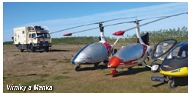
Vírníky a Manka