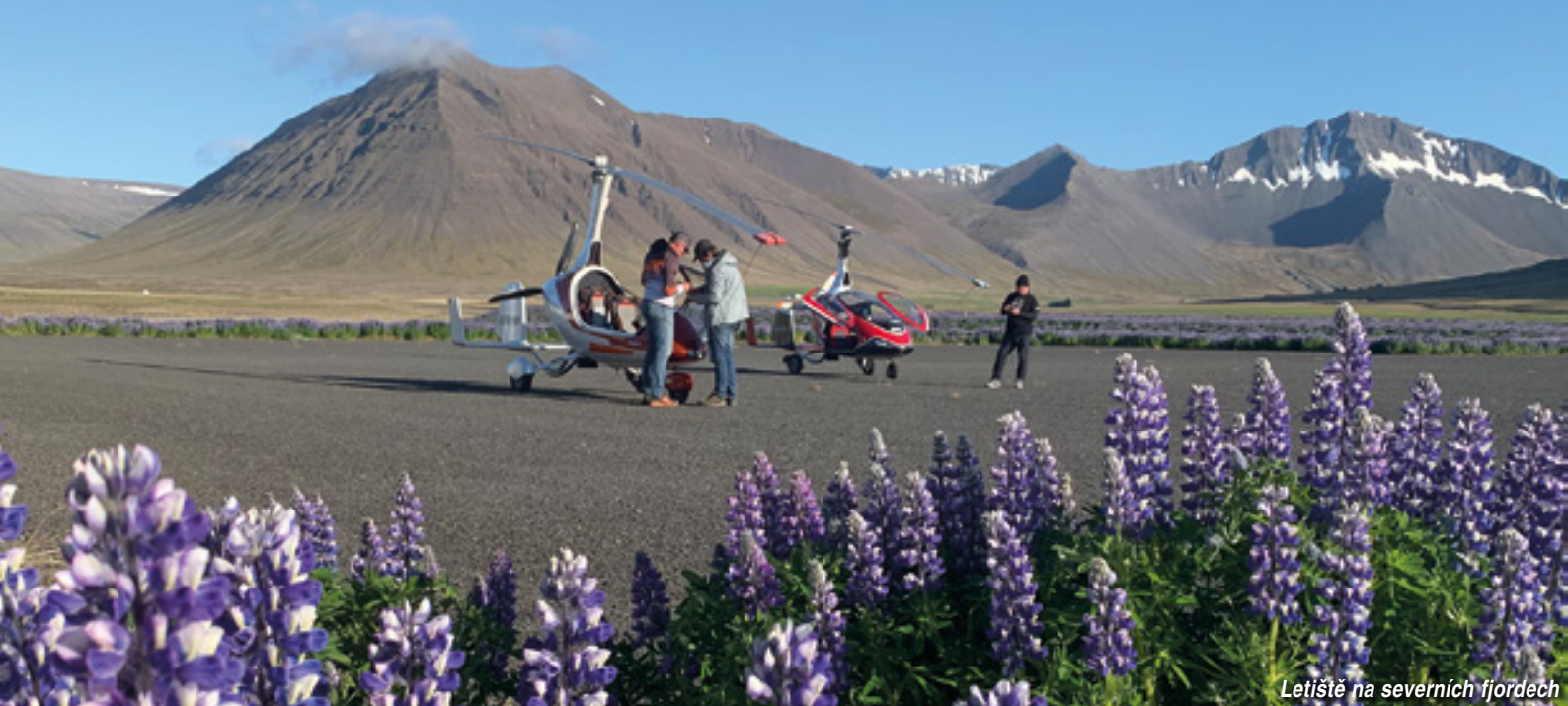
Letiště na severních fjordech