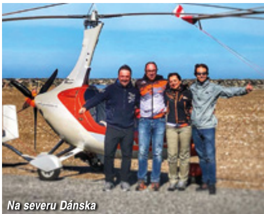
Na severu Dánska